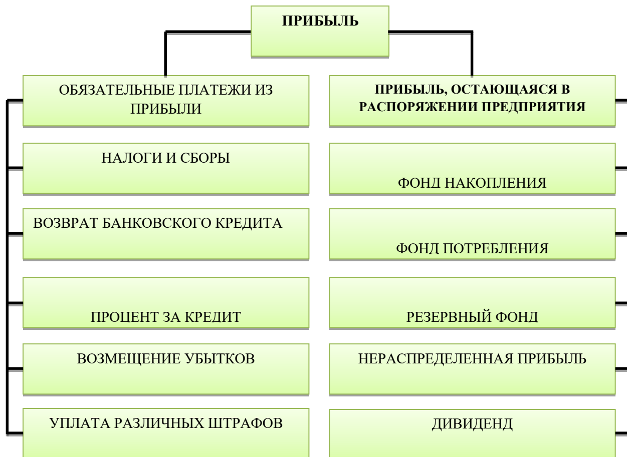
Схема распределения прибыли на предприятиях и в коммерческих организациях

Финансовый менеджмент определяет политику распределения прибыли предприятия, его роль в производственном процессе и стимулы. В результате