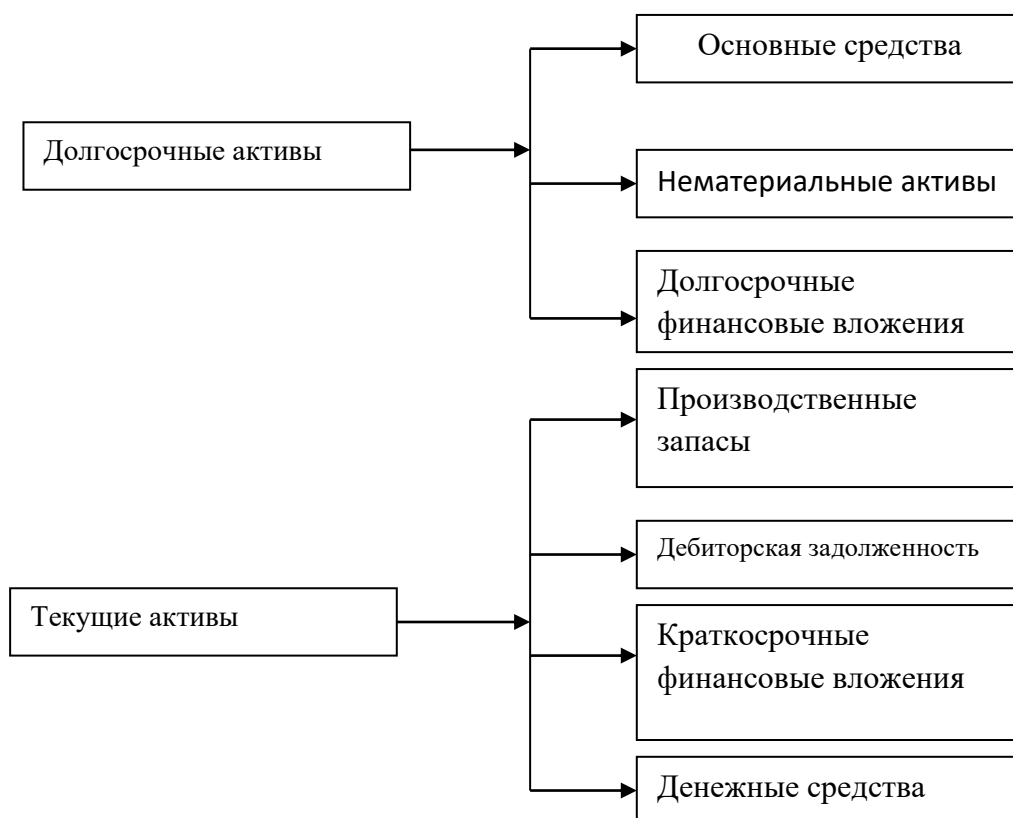
Рисунок 2.5. Формы мобилизации средств предприятия.

В активе бухгалтерского баланса отражаются средства предприятия по формам и уровням их мобилизации (рисунок 2.5).