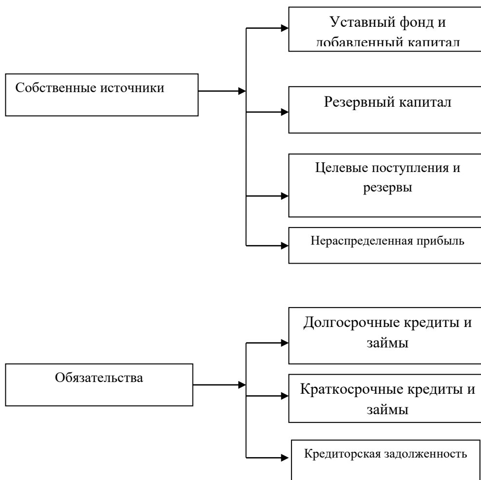
Рисунок 2.6. Источники средств предприятия.

В бухгалтерском балансе предприятия средства компании и их источники отражаются на определенную дату (на начало квартал, на начало или конец года). Итоговая сумма статей актива равняется итоговой сумме пассивных статей. В активе средства отражены по составу и расположению: основные средства, товарно-материальные запасы, денежные средства и т.д. Источники формирования средств указываются в пассиве баланса (средства учредителей, заработанные самим предприятием средства, заемные средства, средства, полученные в виде целевого финансирования).