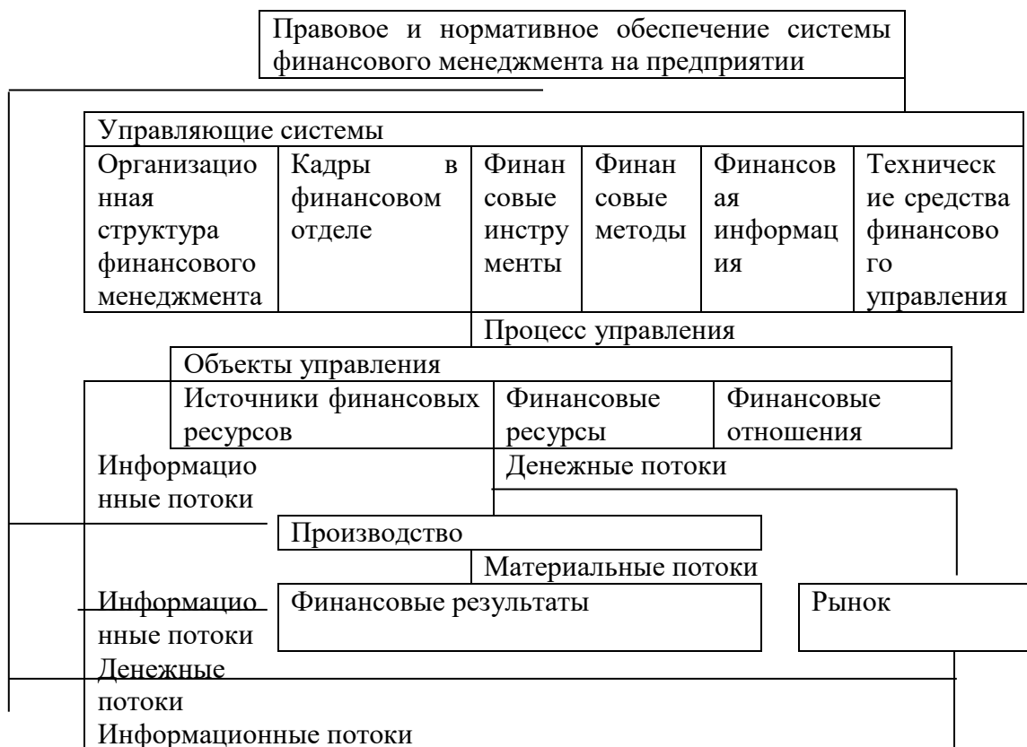
Рисунок 2. 4. Организационная структура системы финансового управления 1 .

Рисунок показывает, что в организации финансового менеджмента на предприятии важную роль играют информационные потоки. Источниками информации являются результаты операционной, финансовой и инвестиционной деятельности предприятия. Таким образом, можно видеть, что информация поступает из производства, с рынков, из бюджета, от собственников и контрагентов. Из производства поступает информация о производстве и реализации продукции, а также о результатах первичного