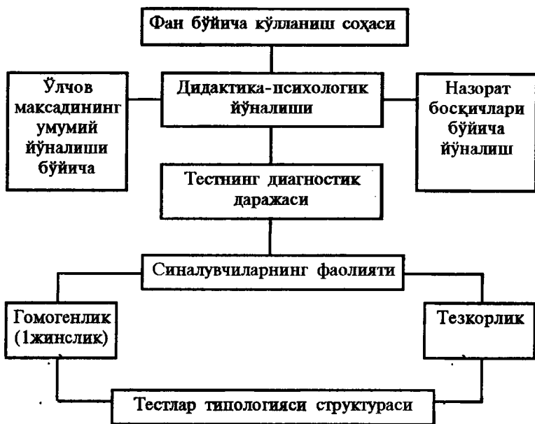
2-чизма. Тестлар типологияси

9. Тестлаштиришни ташкил этиш усулларига эса умумий, индивидуал ёки жуда кам қўлланиладиган лекин жуда самарали ҳисобланган алоҳида усули ва гуруҳлар ҳолида текширилувчиларнинг ташҳисчи билан юзма-юз ҳолис (тестлаштиришнинг ЭҲМ воситаларидаги индивидуал дастурнинг замонавий варианты) туриши кабилар киради.