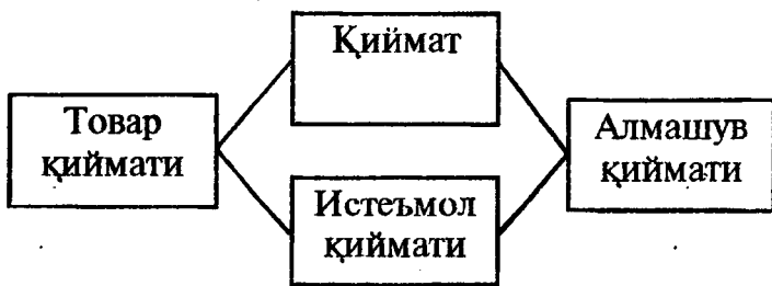
1-чизма. Қиймат тури

Шу нуқтага назардан товарнинг икки хусусияти мавжуд: бир томондан, товар сотиш учун яратилган меҳнат маҳсули, иккинчи томондан, бирон бир эҳтиёжни (кийим-кечак, пойафзал нон, туз, уй-жой) қондирадиган нарсадир. Иқтисодиёт илмида биринчи хусусият қиймат, иккинчи хусусият истеъмол қиймати деб аталади. Демак, қиймат ва истеъмол қиймати товарнинг икки хусусиятини юзага чиқаради.