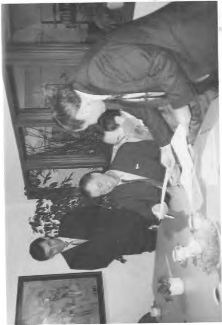
Бремен университети билан шартнома имзолаш чоғида.