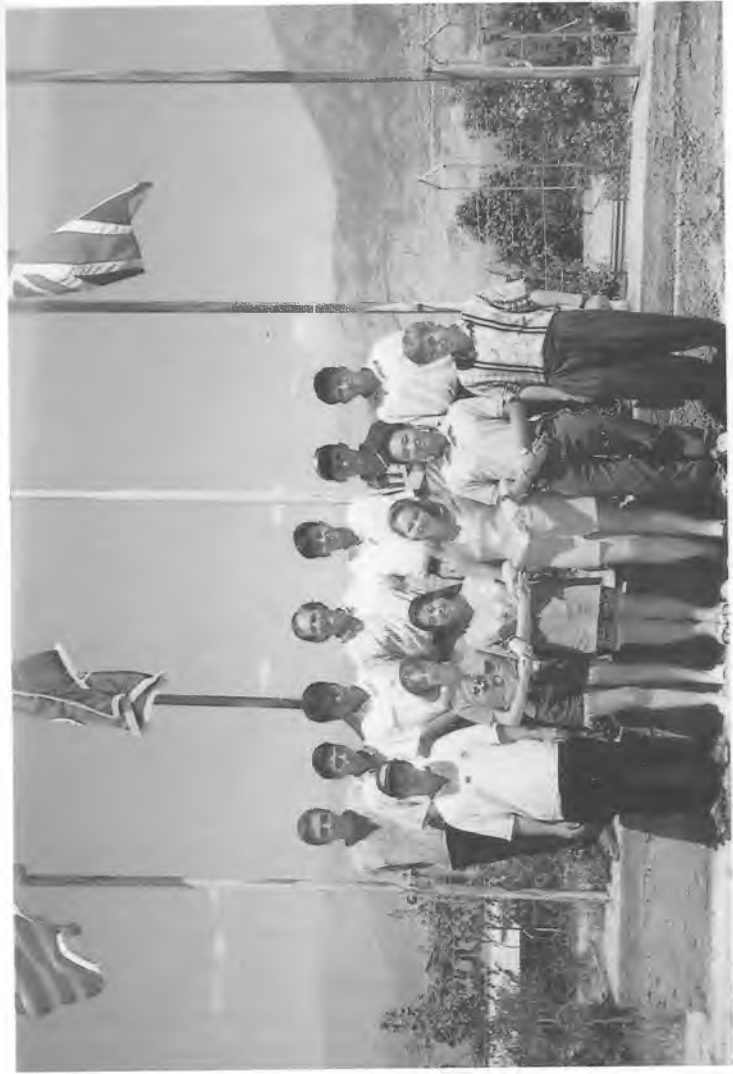
Талабалар Университетнинг «Юсуфхона» оромгоҳида.