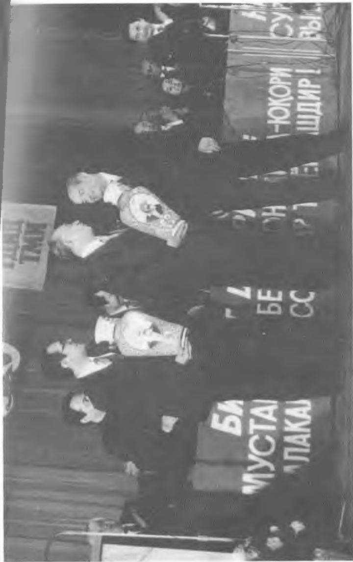
Ўзбекистон Президенти И. Каримов Университетга мукофот топширмақда.