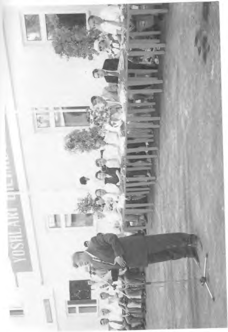
Университет қошидаги лицейда Наврўз тантаналари.