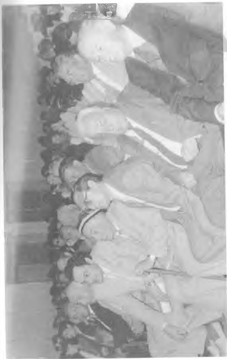
Билимлар кунига багишланган таътаналар.