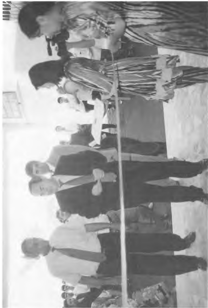
Университет қошидаги гимназиянинг тантанали очилиши.