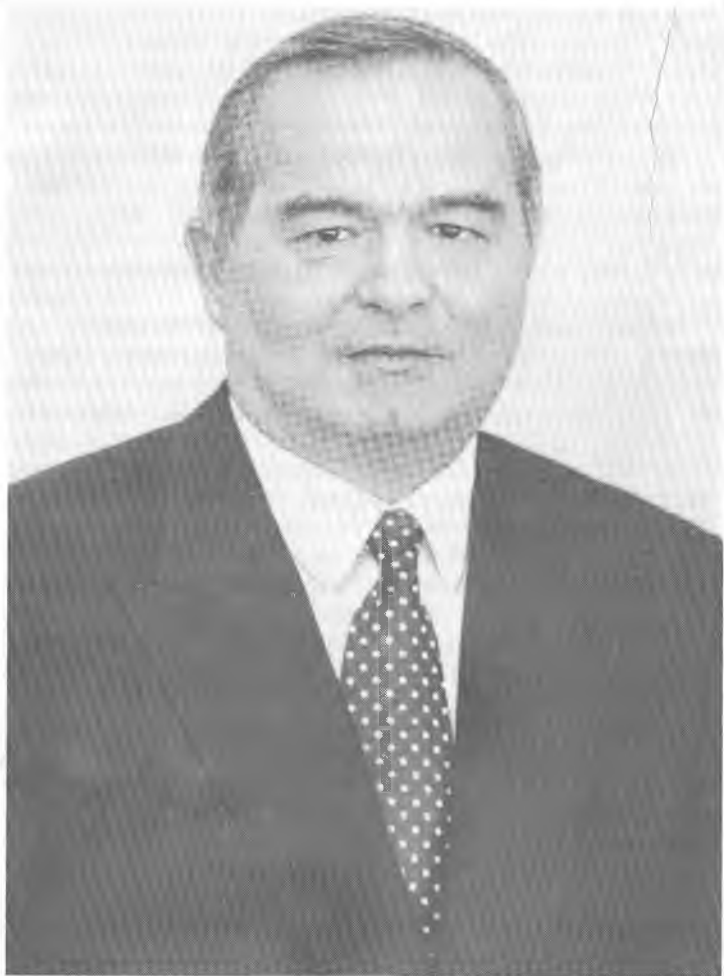
Ўзбекистон Республикаси Президенти И. А. Каримов.

миздан, биринчи навбатда, Ўзбекистон тақдири ва келажаги учун масъул бўлган ёшлардан, уларда замонавий иқтисодий тафаккур, иқтисодий идрок ҳосил қилишдан бошламоқ лозим. Бундай иқтисодий тафаккур заминидо одамларда ўзи ва ўз халқи, Ватани тақдири учун масъулият ҳиссини уйғотиш ётади. Бунга эришиш воситаси иқтисодиёт илмини эгаллаш, иқти-