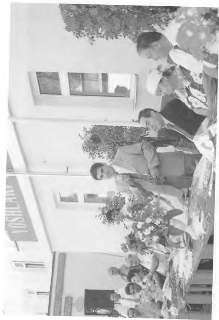
Хотира ва қадрлаш кунига бағишланган тадбирларда.