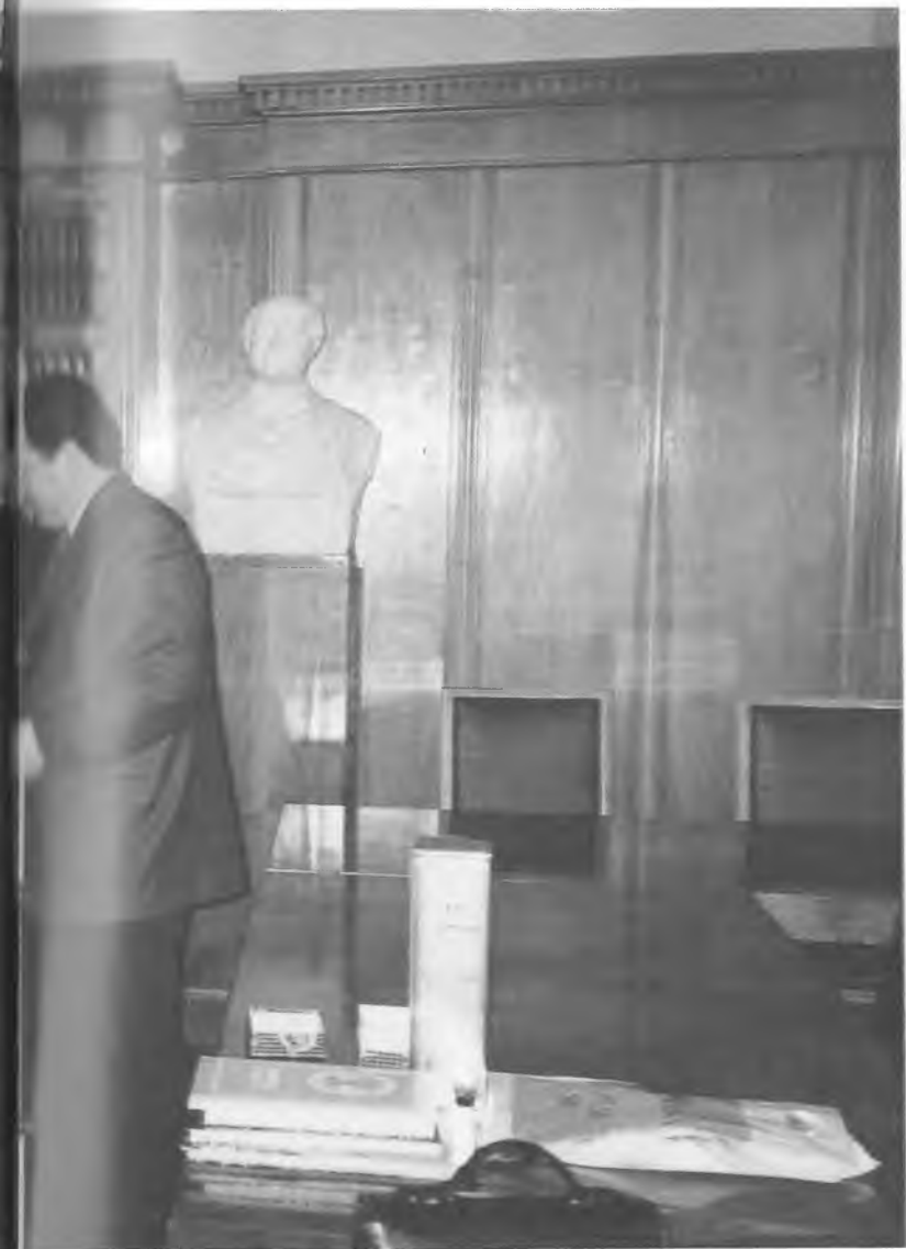
Москва Давлат университети ректори билан мулоқотда.