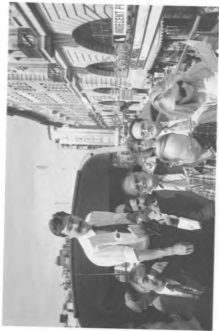
Университет олимлари хориж сафариди