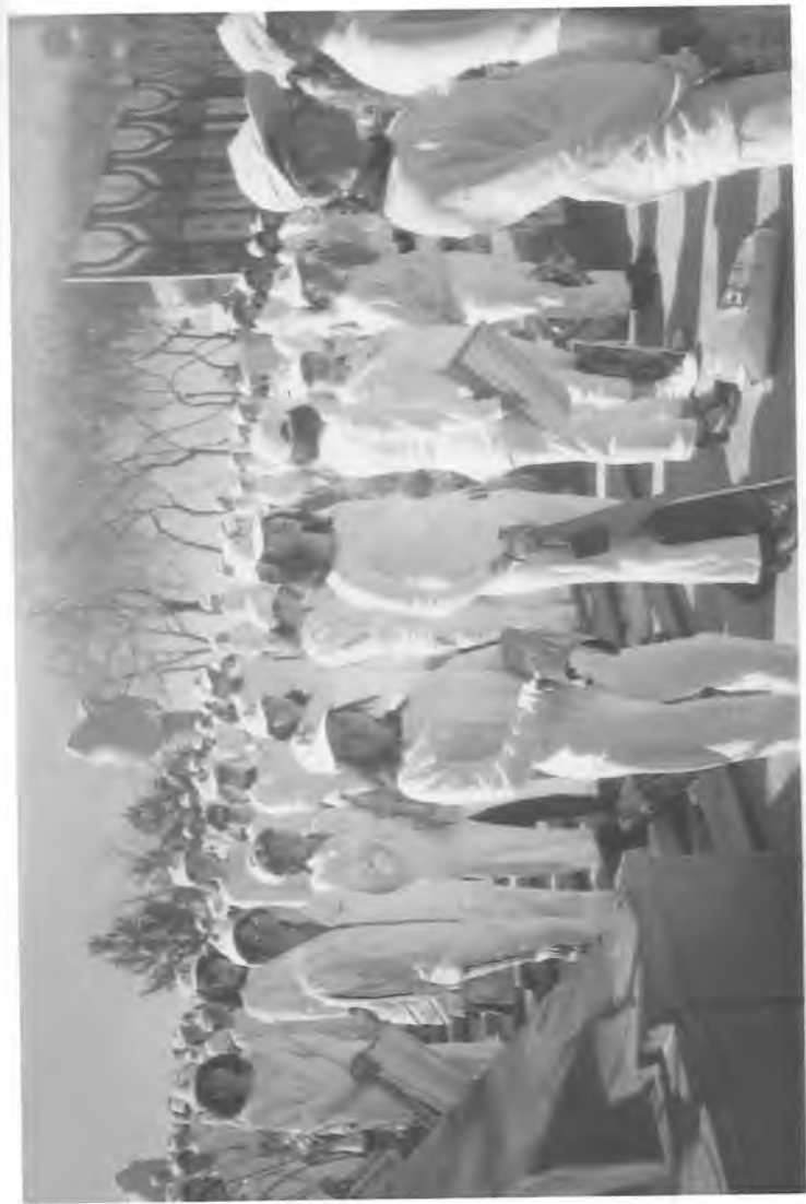
Баркамол авлод келажғимиз.