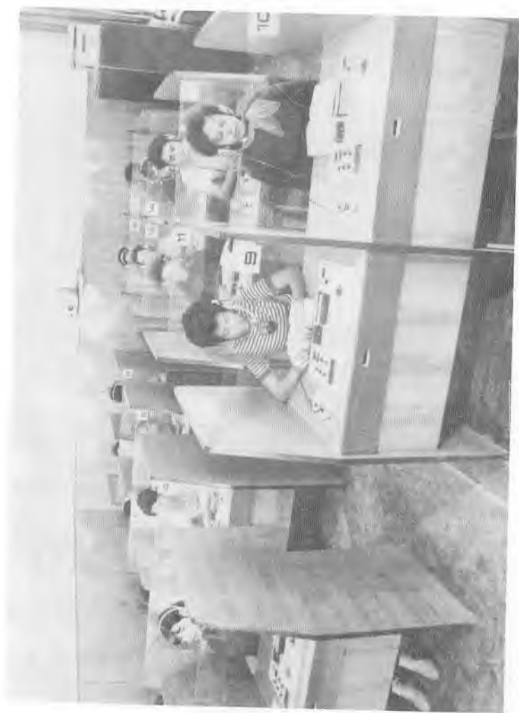
Хорижий талабалар сабоқ лайтида.