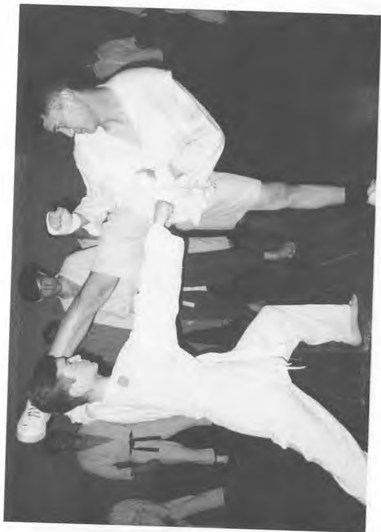
Талабалар спорт машгулоги пайтида.